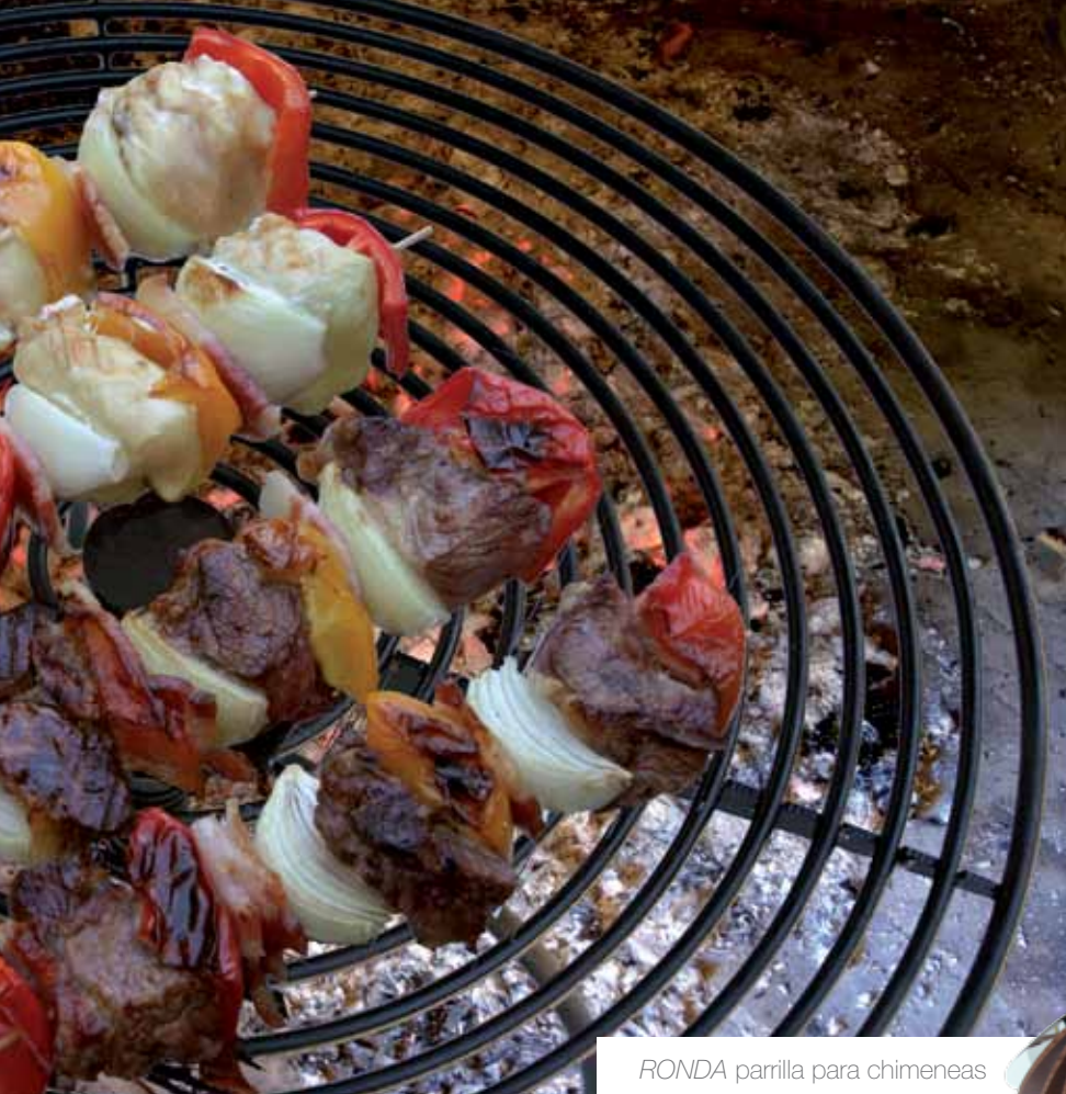
RONDA parrilla para chimeneas TALEGA MADERA frutero