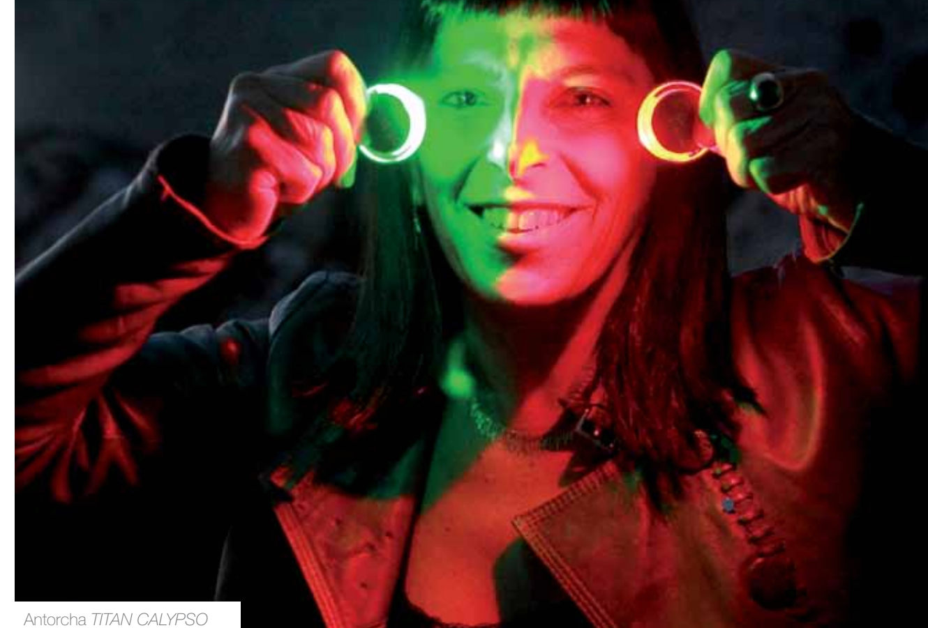
Antorcha TITAN CALYPSO POLUX linterna promocional

“El diseño en los objetos es el rasgo que trasluce lo humano, por el detalle, el criterio, el humor, la estética, el carácter, la manía o la obsesión”