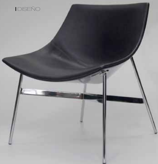
LUNAR sillón ZERO banquetta